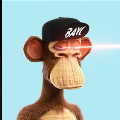
Club de yates de monos aburridos (NFT)

Elija un producto de inversión para empezar y descubra por qué tantos inversores confían en safewealthholdings.com