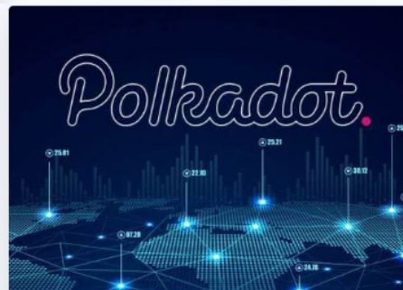
Fondo del ecosistema Polkadot

El fondo Polkadot es un fondo de inversión sobre la red Polkadot creado en asociación con Web3 para inversores.