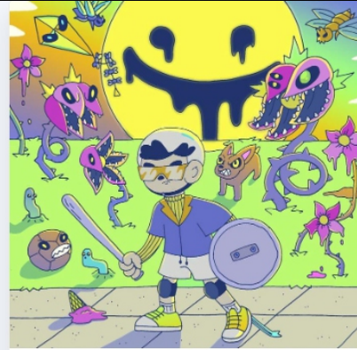
Noches de verano (NFT)

Ventas en curso Precio mínimo actual (4,75 ETH)